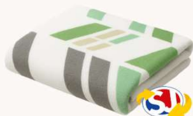
TOALHA DE BANHO CAMESA ADULTO OU INFANTIL 65CMX120CM (EXCETO LOJA MANCINI)