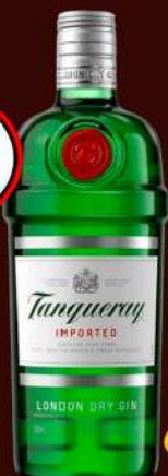
GIN TANQUERAY 750ML (EXCETO LOJA BAIRRO)