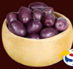
AZEITONA PRETA AZAPA 80/90 A GRANEL A CADA 100G