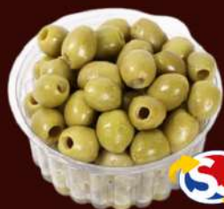
AZEITONA VERDE S/CAROÇO A GRANEL A CADA 100G