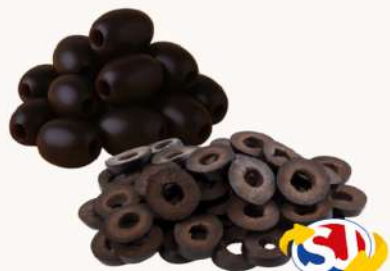
AZEITONA PRETA S/CAROÇO OU FATIADA A GRANEL A CADA 100G (LOJAS FLORIANA, MANCINI E MUZAMBINHO)